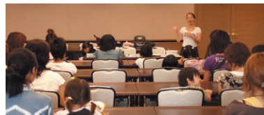
平成19年度親子でハンドマッサージ風景

●地下鉄烏丸御池駅(5番出口)または地下鉄四条駅・ 阪急烏丸駅(20番出口)下車徒歩約5分